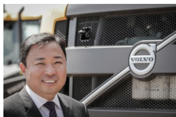
Diretor de marketing da