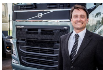
Presidente Volvo Argentina

Volvo Financial Services está apresentando na Fenatran 2015 o seu novo Seguro de Cargas