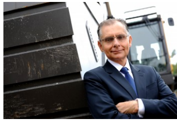
Presidente da Volvo Construction Equipment Latin America.