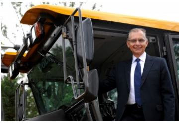
Presidente da Volvo CE Latin America