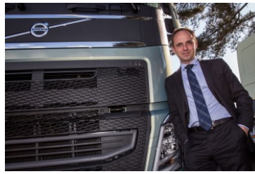
Gerente de Marketing Caminhões