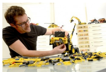
Modelo em miniatura da carregadeira L350F