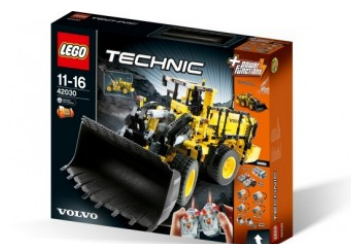
Modelo em miniatura da carregadeira L350F